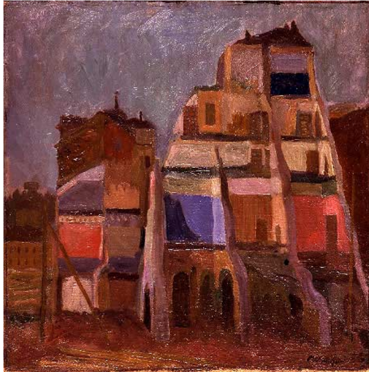
1. M. Mafai, Demolizioni di Via Giulia , 1936