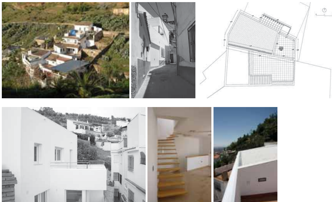
Fig 1. Tipologías de cubiertas en Barranco del Abogado.