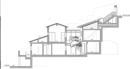
Fig 17. Sección longitudinal de proyecto