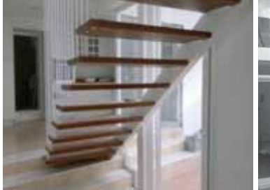
Fig 13. Fachada a Calle San Luís estado preexistente (año 2008)